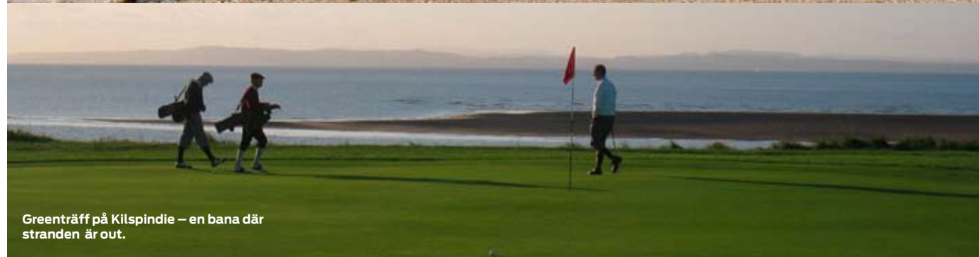
Greenträff på Kilspindie – en bana där stranden är out.