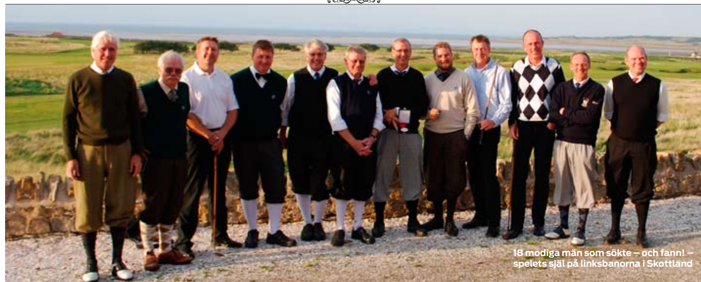
18 modiga män som sökte – och fann! – spelets själ på linksbanorna i Skottland