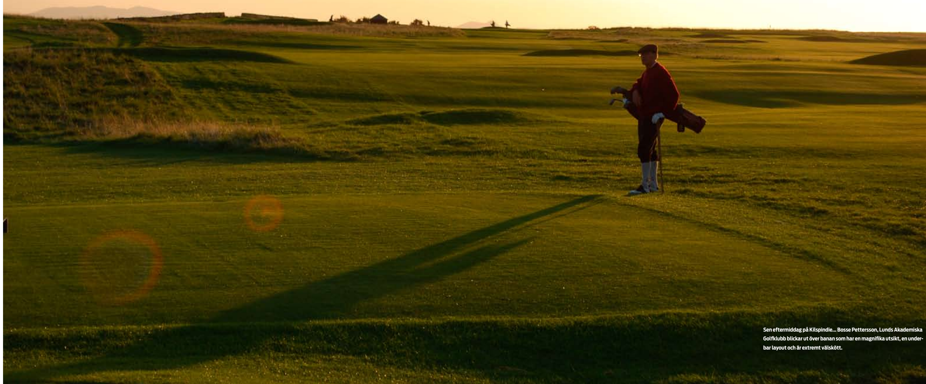
Sen eftermiddag på Kilspindie... Bosse Pettersson, Lunds Akademiska Golfklubb blickar ut över banan som har en magnifika utsikt, en underbar layout och är extremt välskött.